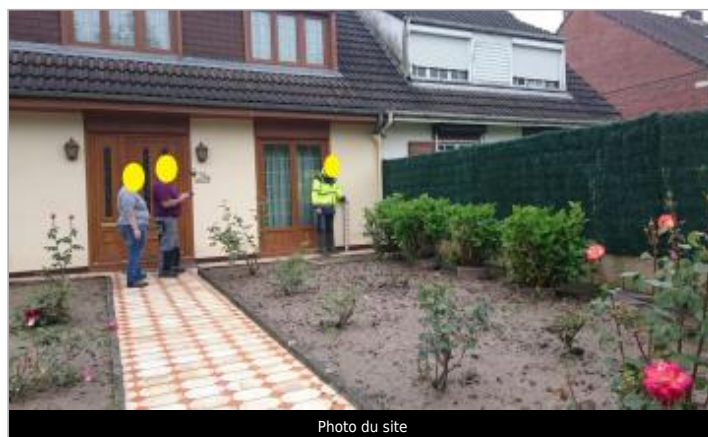
Photo du site