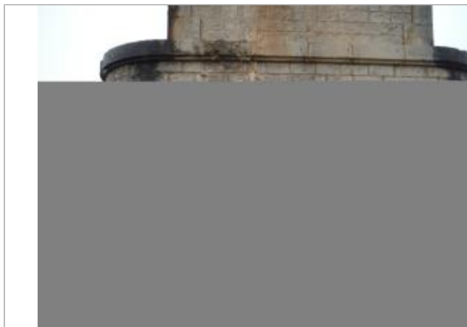
Débordement de cours d'eau

Coordonnées RGF93 (ETRS89) : X: 3.7149614 / Y: 43.561262