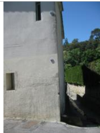
Débordement de cours d'eau