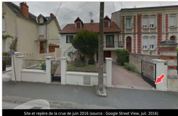
Site et repère de la crue de juin 2016 (source : Google Street View, juil. 2016)

GÉOLOCALISATION Coordonnées WGS84 : X: 1.98301950 / Y: 46.95045600 Coordonnées RGF93 (Lambert 93) X: 622654.48 / Y: 6650526.17 Coordonnées RGF93 (ETRS89) : X: 1.9830195 / Y: 46.950456 Code Hydro: K61-0310 Rive de référence: Non renseigné