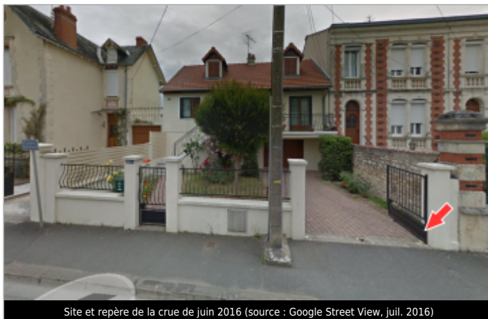
Site et repère de la crue de juin 2016

GÉOLOCALISATION Coordonnées WGS84 : X: 1.98301950 / Y: 46.95045600 Coordonnées RGF93 (Lambert 93) X: 622654.48 / Y: 6650526.17 Coordonnées RGF93 (ETRS89) : X: 1.9830195 / Y: 46.950456 Code Hydro: K61-0310 Rive de référence: Non renseigné