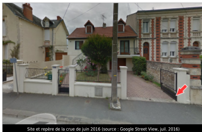
Site et repère de la crue de juin 2016 (source : Google Street View, juil. 2016)