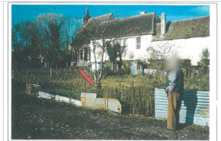
Repère en 2000 (source : COMIREM)