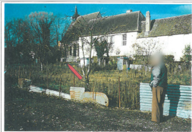
Repère en 2000 (source : COMIREM)