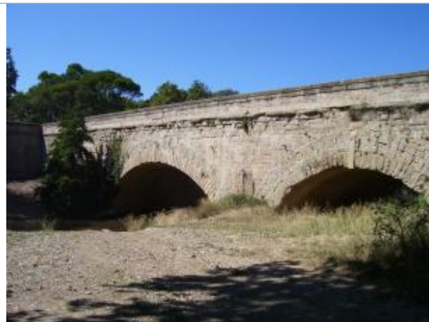
face aval du pont canal

Coordonnées RGF93 (ETRS89) : X: 2.915514 / Y: 43.280057