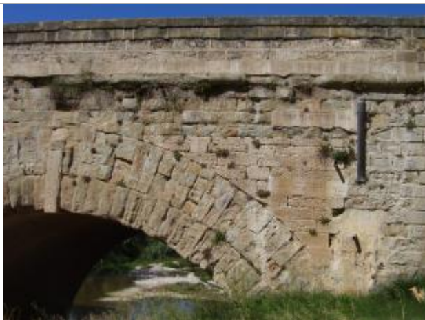
marque sur la face aval du pont canal