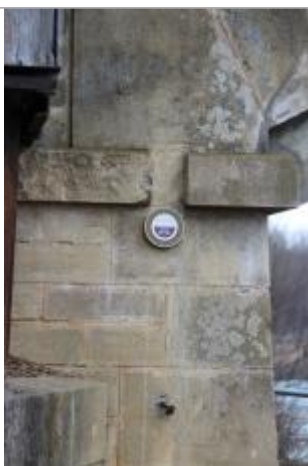
Vue repère de crue

Altitude calculée de l'eau (en m) : 7.96 m