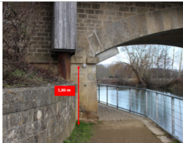
Sèvre Niortaise, La Tiffardière