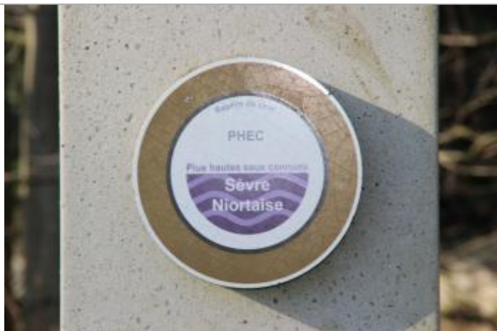
Vue repère de crue

Altitude calculée de l'eau (en m) : 9.15