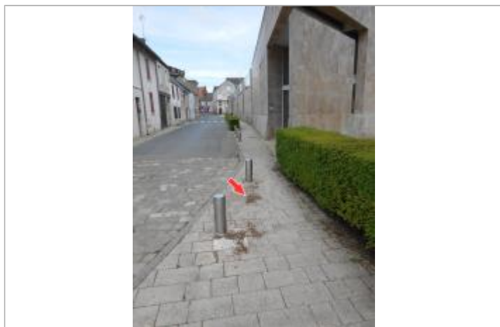
Repère de la crue de juin 2016

Altitude calculée de l'eau (en m) : 128.744 m