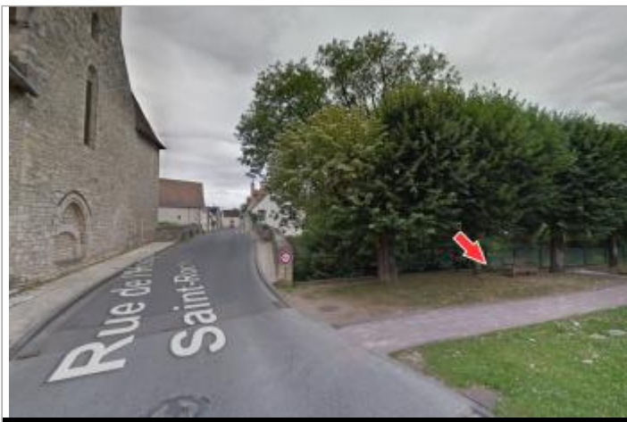
Site et repère de la crue de juin 2016