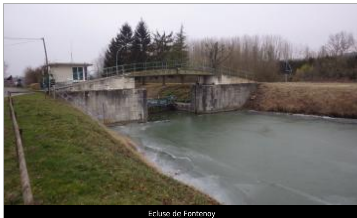
Ecluse de Fontenoy