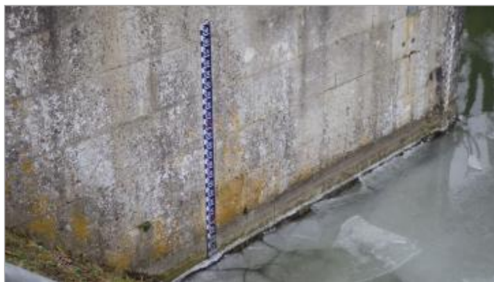
Echelles amont de l'écluse de Fontenoy