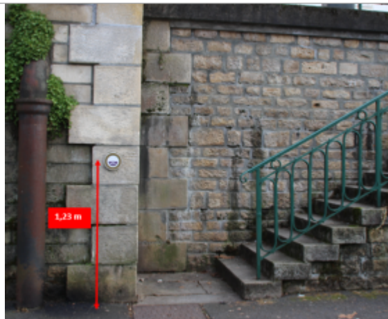
Sèvre Niortaise, 183 quai de la Regratterie

Code Hydro: N---0060 Rive de référence: Gauche