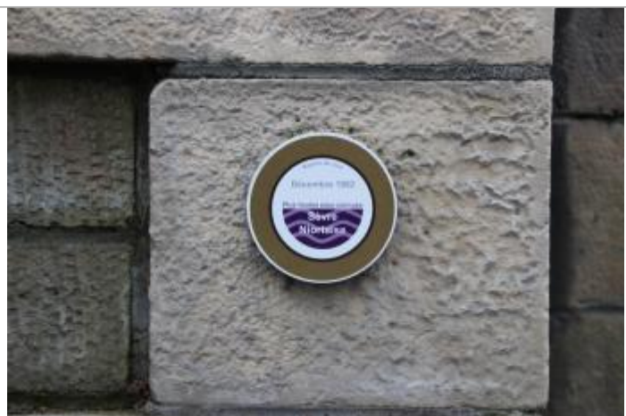
Vue repère de crue

Altitude calculée de l'eau (en m) : 14.83 m