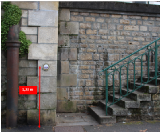
Sèvre Niortaise, 183 quai de la Regratterie