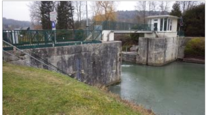
amont écluse de Vauxrot à Soissons