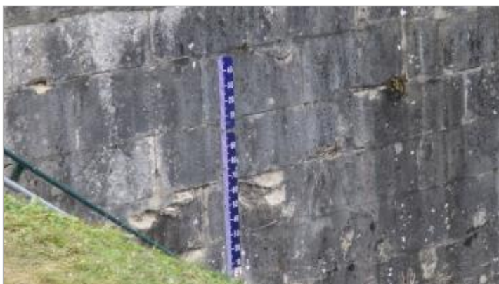
Echelle amont de l'écluse de Vauxrot