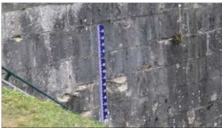
Echelle amont de l'écluse de Vauxrot