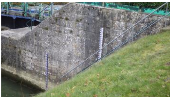
Echelle aval de l'écluse de Soissons Vauxrot