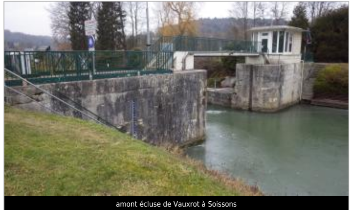
amont écluse de Vauxrot à Soissons