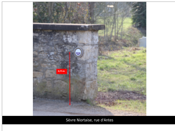
Sèvre Niortaise, rue d'Antes