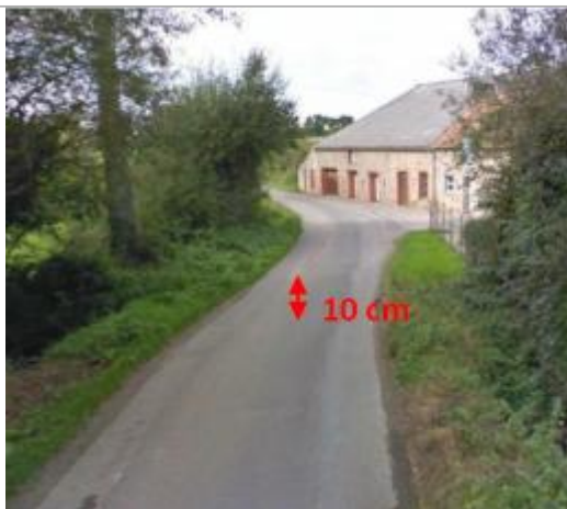
D505 vers 1 Hameau Valtot