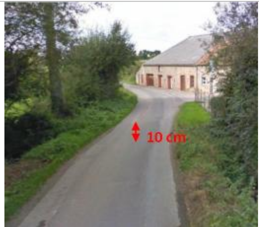
D505 vers 1 Hameau Valtot

Coordonnées WGS84 : X: -1.69021800 / Y: 49.57813800