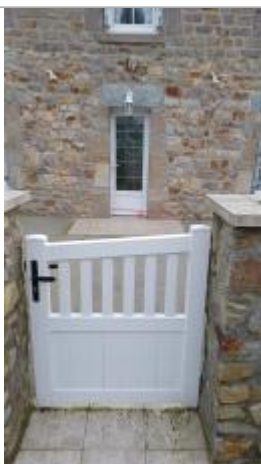
Laisse de crue à 10 cm/sol

Altitude calculée de l'eau (en m) : 27.62 m