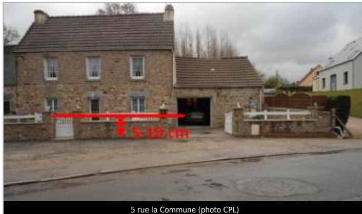
5 rue la Commune