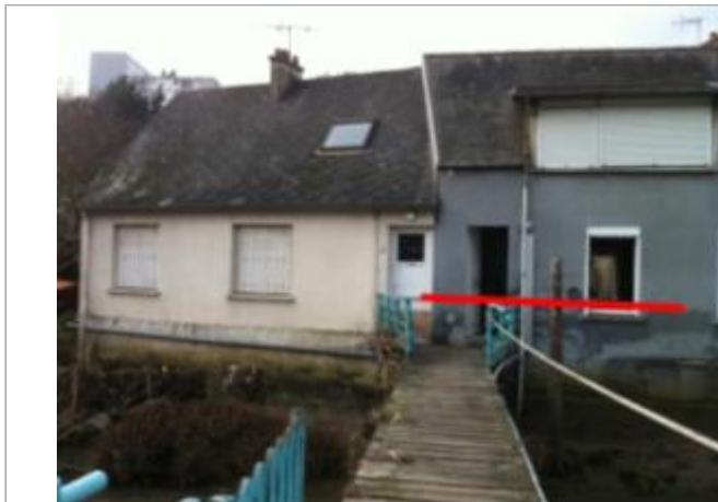
20 avenue de Paris

Coordonnées WGS84 : X: -1.61858700 / Y: 49.62890800