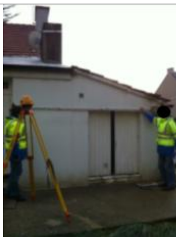
50 route de la Vallée de Quicampoix

Altitude calculée de l'eau (en m) : 15.94 m