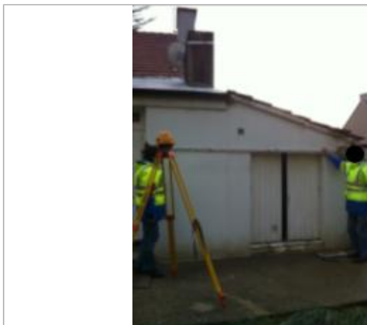
50 route de la Vallée de Quicampoix

Coordonnées WGS84 : X: -1.62523700 / Y: 49.62088000