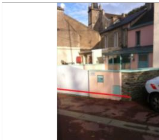
195 avenue de Paris