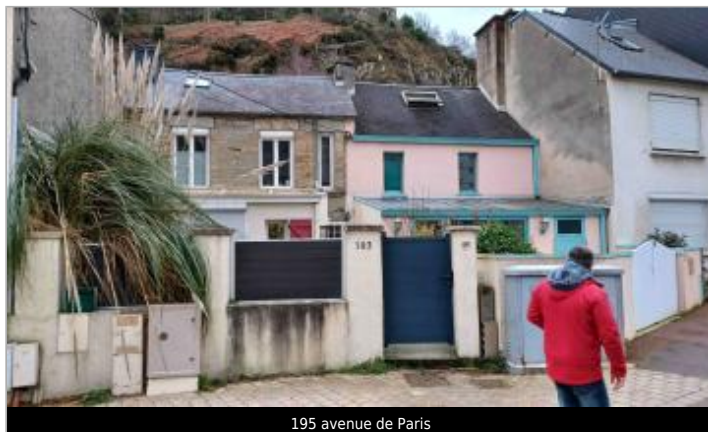
195 avenue de Paris