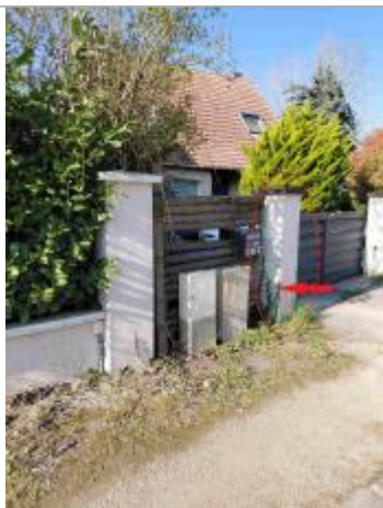
Laisse de crue à 47 cm/sol.

Altitude calculée de l'eau (en m) : 97.28 m