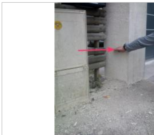
Pilier du n°18 bis rue de l'Espérance