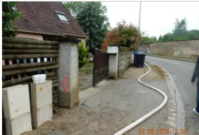
Pilier du n°18 bis rue de l'Espérance