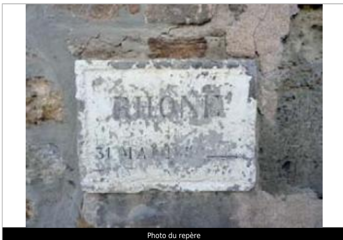
Photo du repère

Différence entre le niveau d'eau et la référence (en m) : 1.060 m