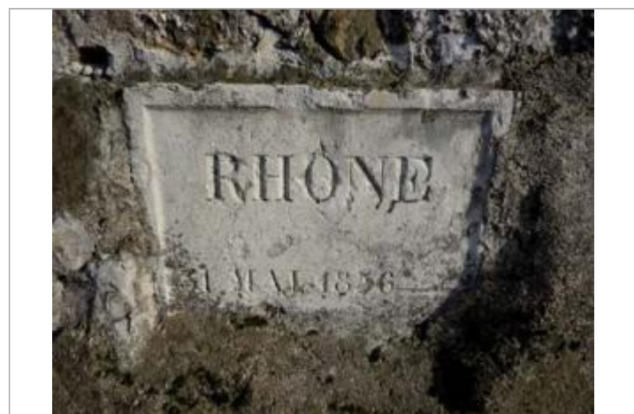
Photo du repère

GÉNÉRAL Code : RH1_R_07lepouz01_1 Date de mise à jour : 28/06/2022 Auteur : SPC GD