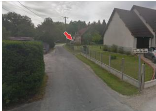
Site et repère de la crue de juin 2016