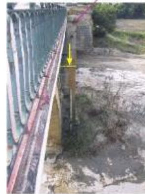
Collias : RD 3, niveau sur pilier du Pont sur le Gardon