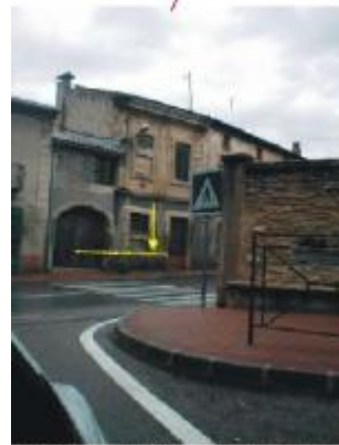
Valliguières : RH 86, laisse de crue sur habitation