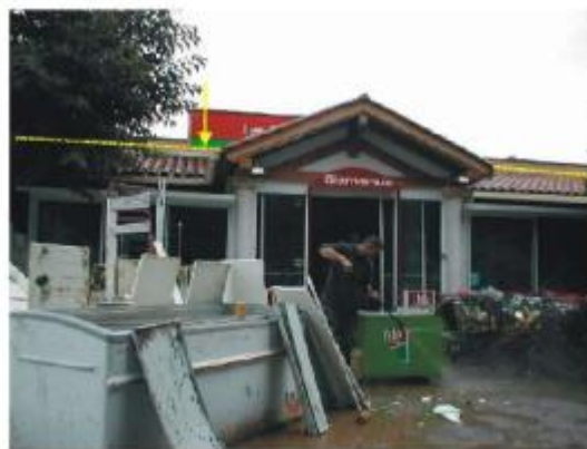
Goudargues : Superette "Lille"