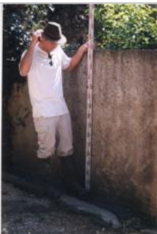
Photo du repère

Altitude calculée de l'eau (en m) : 29.042 m