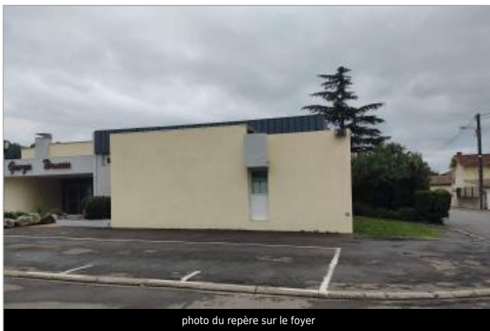
photo du repère sur le foyer