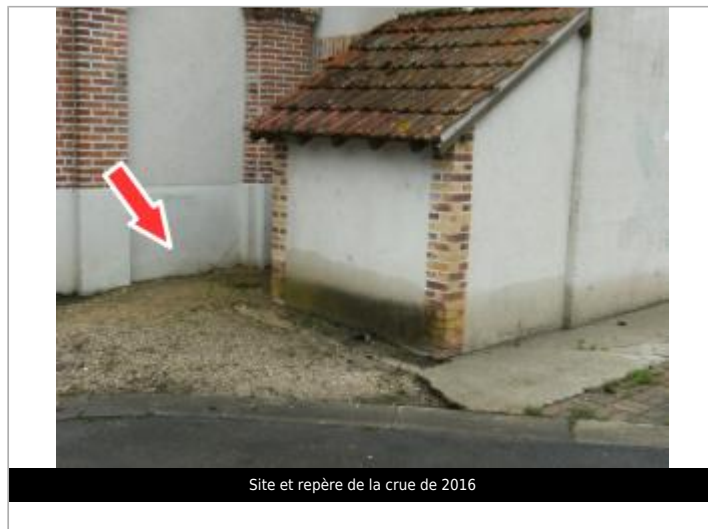
Site et repère de la crue de 2016