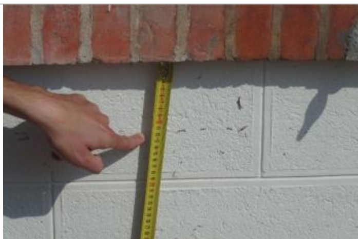
Détail du repère