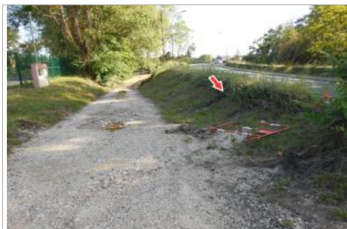
Site et repère de la crue de juin 2016

GÉOLOCALISATION Coordonnées WGS84 : X: 2.05210210 / Y: 47.43325400 Coordonnées RGF93 (Lambert 93) X: 628551.99 / Y: 6704084.73 Coordonnées RGF93 (ETRS89) : X: 2.0521021 / Y: 47.433254 Code Hydro: K6--0250 Rive de référence: Droite