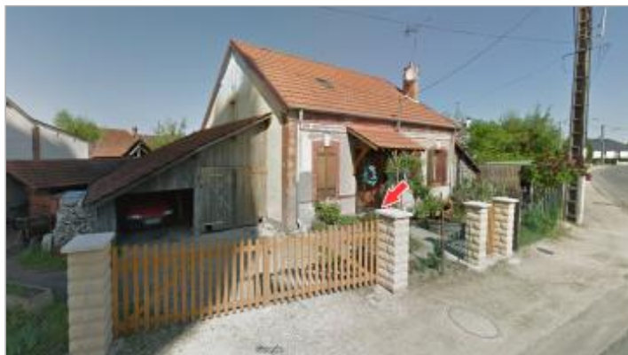
Site et emplacement du repère de la crue de juin 2016 (source : Google Street View, mai 2013)