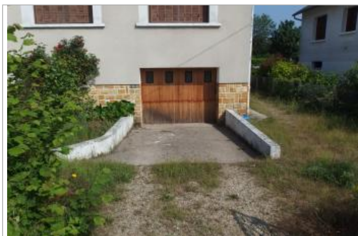
Site et repère de la crue de 2016