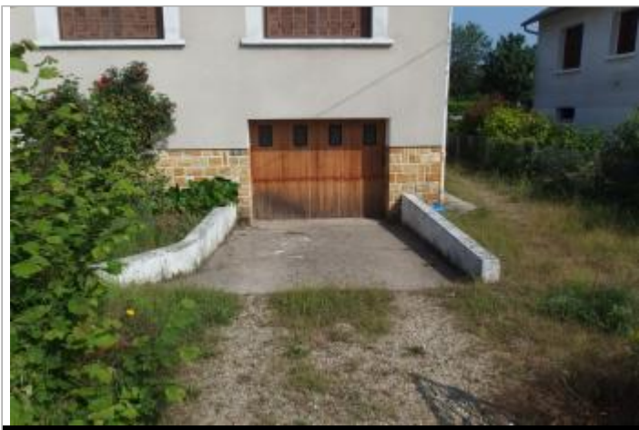
Site et repère de la crue de 2016

GÉOLOCALISATION Coordonnées WGS84 : X: 2.05482500 / Y: 47.43479500 Coordonnées RGF93 (Lambert 93) X: 628759.27 / Y: 6704253.44 Coordonnées RGF93 (ETRS89) : X: 2.054825 / Y: 47.434795 Code Hydro: K6--0250 Rive de référence: Droite