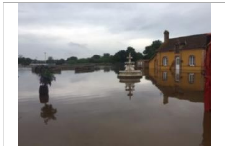
Site et repère de la crue de juin 2016 pendant la crue

GÉNÉRAL Code : LCI1606SAL_R_02_01 Date de mise à jour : 16/04/2018 Auteur : SPC LCI