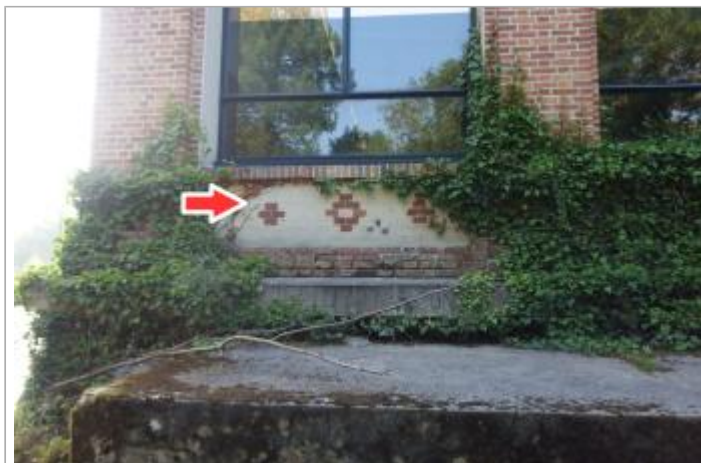
Site et repère de la crue de juin 2016

Coordonnées WGS84 : X: 2.03939310 / Y: 47.42449100 Coordonnées RGF93 (Lambert 93) X: 627582.25 / Y: 6703122.91 Coordonnées RGF93 (ETRS89) : X: 2.0393931 / Y: 47.424491 Code Hydro: K6--0250 Rive de référence: Gauche