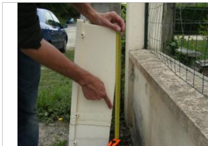
Détail du repère

Altitude calculée de l'eau (en m) : 104.76