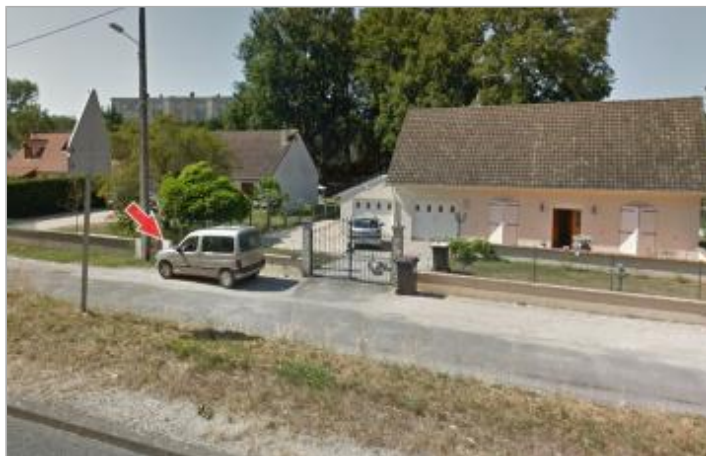
Site et repère de la crue de juin 2016