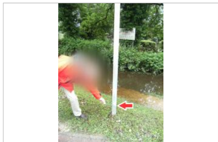
Repère de la crue de juin 2016

GÉNÉRAL Code : LCI1606SAL_R_33_01 Date de mise à jour : Auteur : SPC LCI 19/02/2018