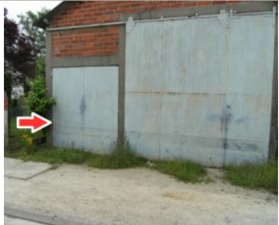
Site et repère de la crue de juin 2016