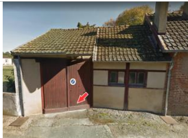
Site et repère de la crue de juin 2016

Coordonnées WGS84 : X: 2.05191170 / Y: 47.43091300