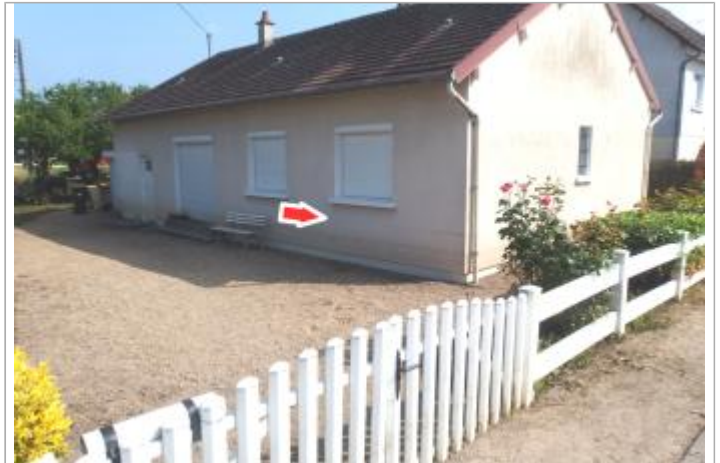
Site et repère de la crue de juin 2016