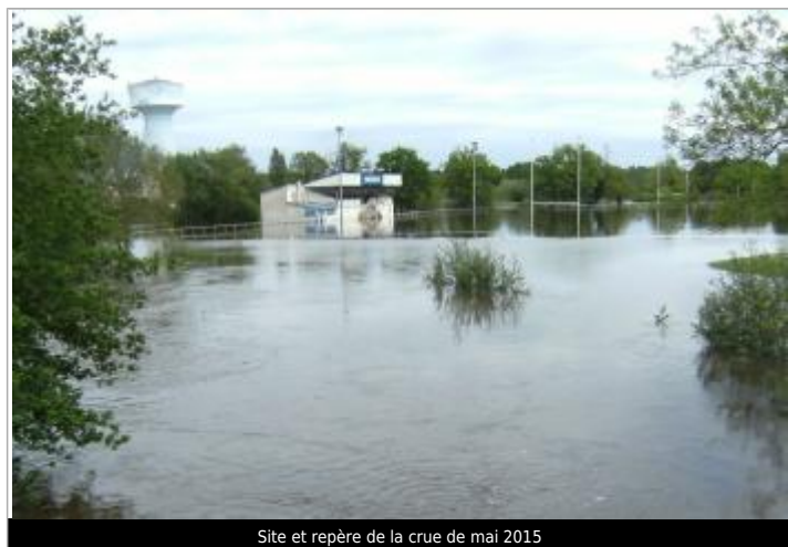
Site et repère de la crue de mai 2015