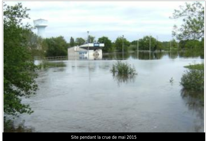
Site pendant la crue de mai 2015

Coordonnées WGS84 : X: 2.05675630 / Y: 47.43125900