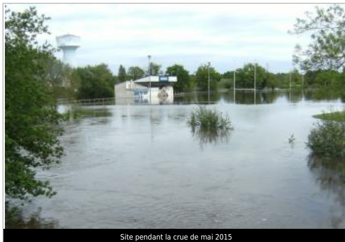
Site pendant la crue de mai 2015