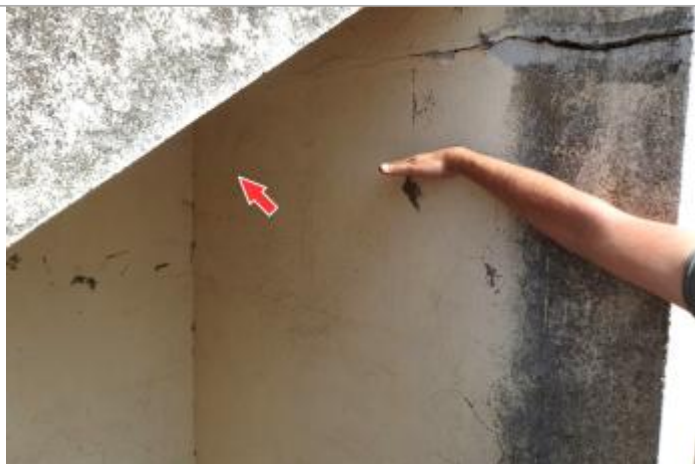
Repère de la crue de juin 2016

Altitude calculée de l'eau (en m) : 105.11