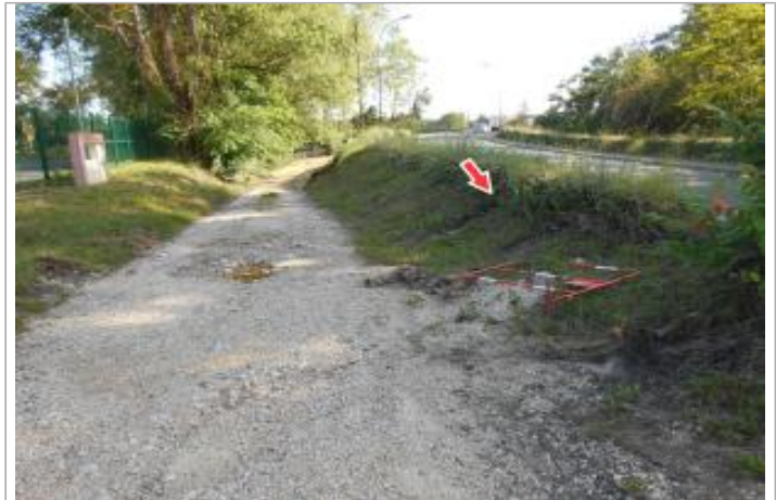
Site et repère de la crue de juin 2016

Coordonnées WGS84 : X: 2.05210210 / Y: 47.43325400