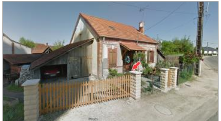
Site et emplacement du repère de la crue de juin 2016

Coordonnées WGS84 : X: 2.05611740 / Y: 47.43238600