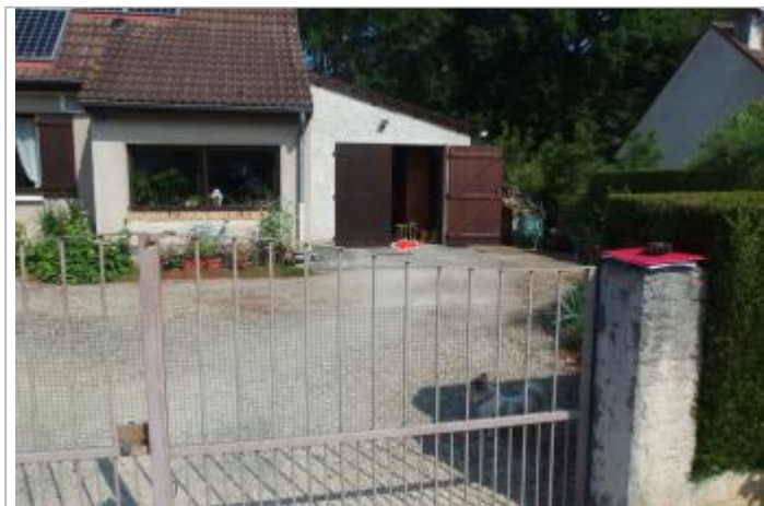
Site et repère de la crue de juin 2016