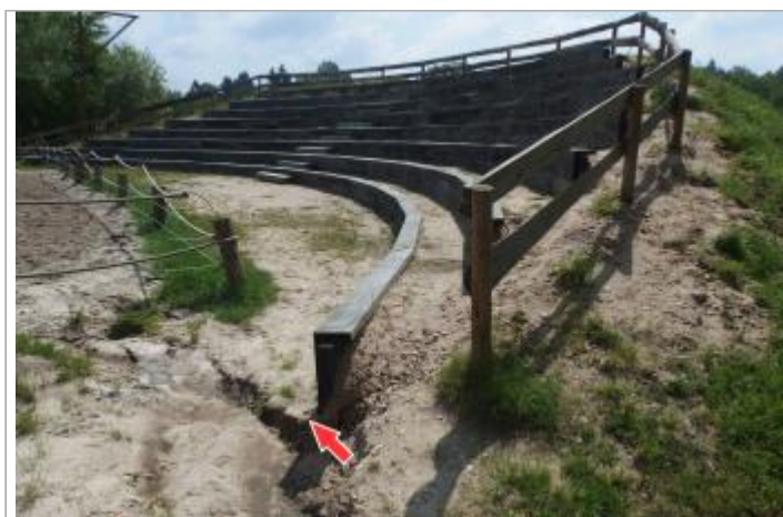
Site et repère de la crue de juin 2016, juste après la décrue

GÉOLOCALISATION Coordonnées WGS84 : X: 2.06578200 / Y: 47.43487000 Coordonnées RGF93 (Lambert 93) X: 629585.19 / Y: 6704251.94 Coordonnées RGF93 (ETRS89) : X: 2.065782 / Y: 47.43487 Code Hydro: K6--0250 Rive de référence: Droite