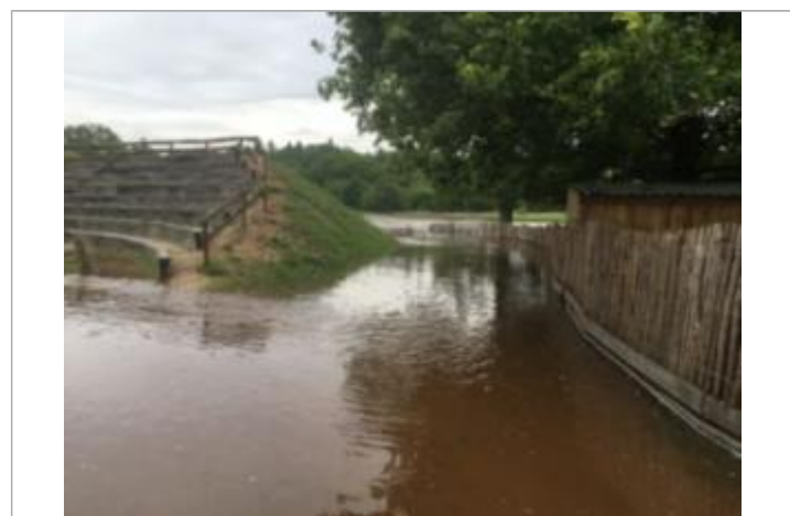
Site et repère de la crue de juin 2016 pendant la crue

GÉNÉRAL Code : LCI1606SAL_R_01_01 Date de mise à jour : 19/02/2018 Auteur : SPC LCI