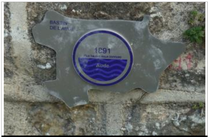
repère fixé sur la face amont de la culée en rive droite du Pont Rouge

MARQUE Texte : 1891 Maximum de l'inondation : Oui Visibilité : Oui État du repère : Bon Pérennité : Longue