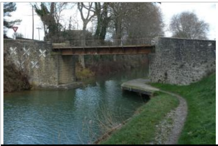
Pont Rouge sur le canal du Midi à Carcassonne

GÉOLOCALISATION Coordonnées WGS84 : X: 2.37994740 / Y: 43.24085000 Coordonnées RGF93 (Lambert 93) X: 649605.93 / Y: 6238159.45 Coordonnées RGF93 (ETRS89) : X: 2.3799474 / Y: 43.24085 Code Hydro: Y1--0200 Rive de référence: Gauche