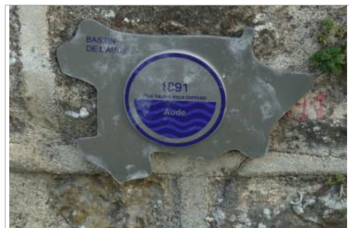
repère fixé sur la face amont de la culée en rive droite du Pont Rouge