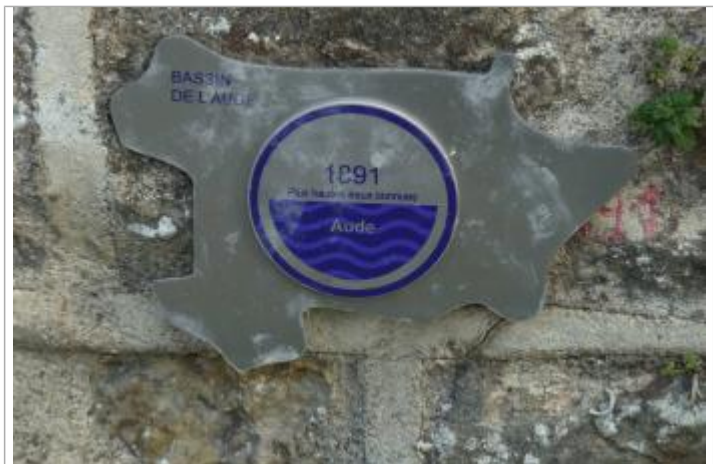
repère fixé sur la face amont de la culée en rive droite du Pont Rouge

MARQUE Texte : 1891 Maximum de l'inondation : Oui Visibilité : Oui État du repère : Bon Pérennité : Longue